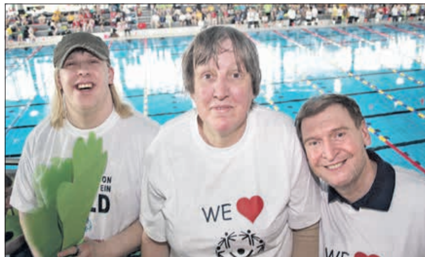
Mit einer Gruppe von Mitarbeitern ging es bei der Lebenshilfe natürlich auch zum Anfeuern ins Schwimmsport-Leistungszentrum.