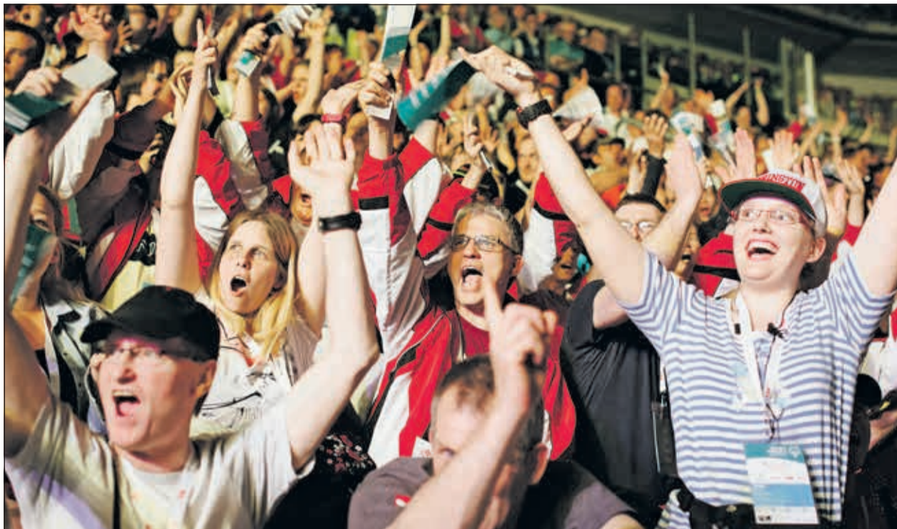
Die Stimmung bei der Eröffnungsveranstaltung im ISS Dome war fantastisch.