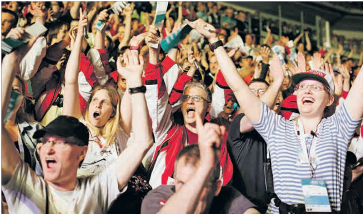
Die Stimmung bei der Eröffnungsveranstaltung im ISS Dome war fantastisch.