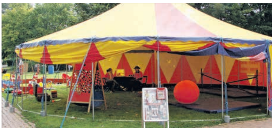
Zwei Zirkuszelte werden am Steinkreis einen tollen Rahmen für kleine und große Mitmach-Künstler bieten. Die Zirkus-Pädagogen freuen sich auf Sie.

Vervollständigt wird das Angebot von einem inklusiven Bühnenprogramm mit Musik, Theater und Tanz.