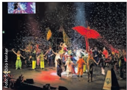
Die bunte Truppe aus Marsberg verzaubert das Publikum.