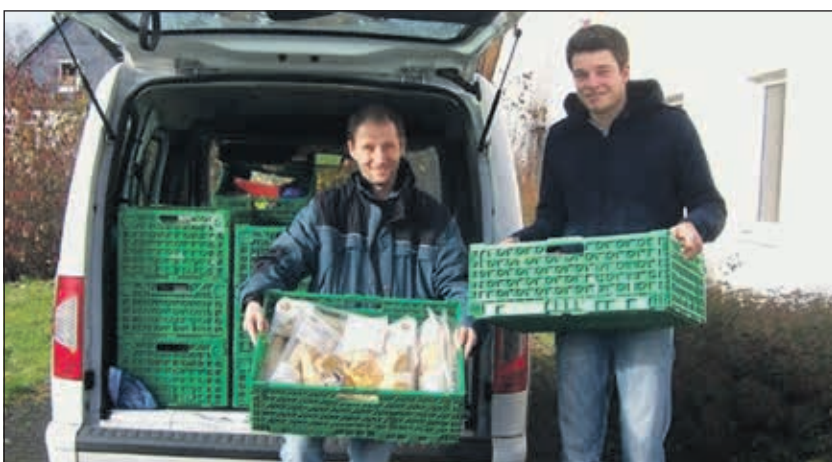
Die Spenden des „Regalfloh“ kommen dem Lebenshilfe Netphener Tisch zugute.

Netphener Tisch zugute. So unterstützen viele Kunden des „Regalfloh“ die Arbeit des Projekts – sei es durch den Kauf von Gegenständen aus dem „Lebenshilfe Netphener Tisch-Regal“ oder durch die Spende von Gegenständen, die in diesem Regal verkauft werden können. Insgesamt sind auf diesem Wege mehr als 800 Euro für den Lebenshilfe Netphener Tisch zusammen gekommen! vk