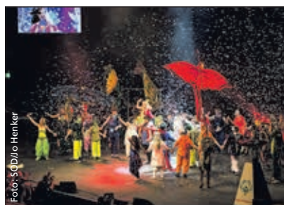
Die bunte Truppe aus Marsberg verzaubert das Publikum.