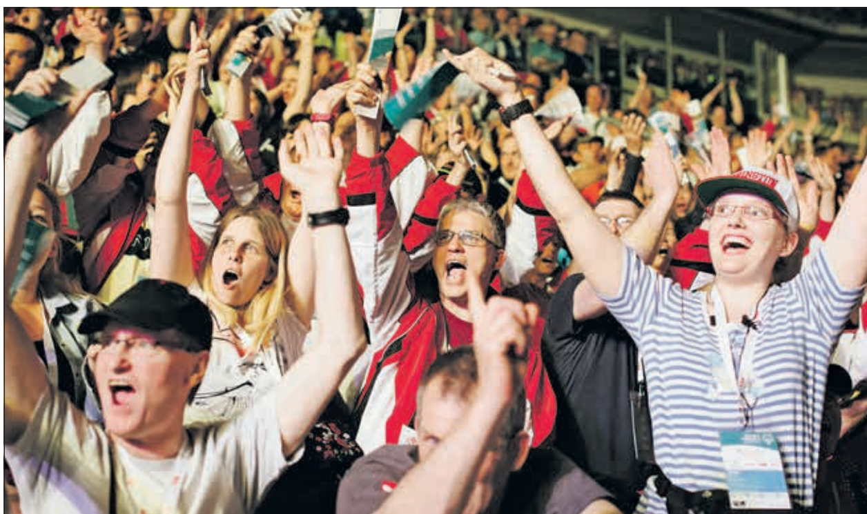
Die Stimmung bei der Eröffnungsveranstaltung im ISS Dome war fantastisch.