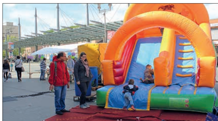
Oliver Müller betreute ehrenamtlich die Hüpfburg während des Aktionstages.

Aktionstag des Lebenshilfe Center Siegen in der Innenstadt