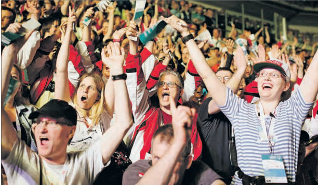
Die Stimmung bei der Eröffnungsveranstaltung im ISS Dome war fantastisch.