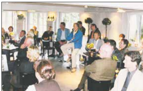
Offizielle Eröffnung des Cafés

Weitere Umbauten folgten. 2008 sollte das Haus auch für die Öffentlichkeit geöffnet werden. Die Klausie wurde komplett saniert und unser jetziges Café/Bistro hat dort seit dem 1. September 2008 seinen Platz gefunden. Besuchen Sie uns doch einmal. Wir freuen uns auf Sie. Dick