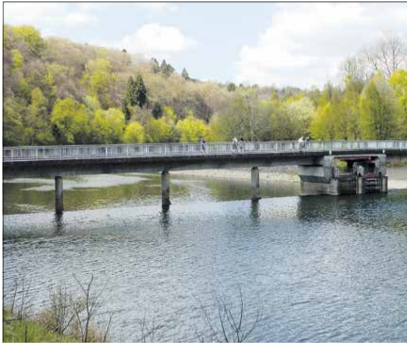
Natur erleben und wandern im Bergischen Land

Schöne Rastbänke am Wasser laden zum Verweilen ein. Dort die gesamte Wuppervorsperre umrunden und dann gelangen Sie wieder zur Vorsperre, überqueren die Brücke