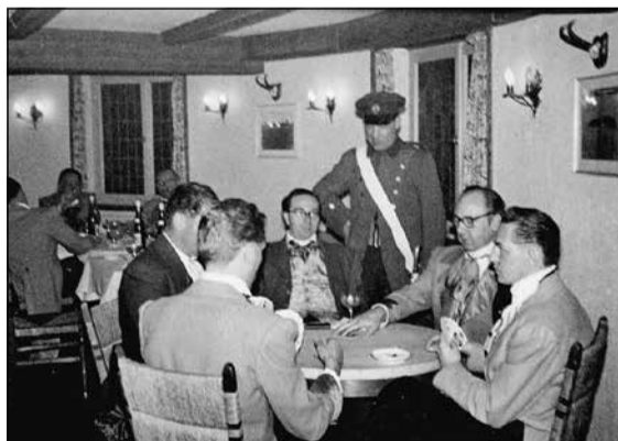
Hammerstein damals