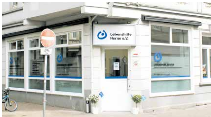
Das neue Lebenshilfe Center in Herne