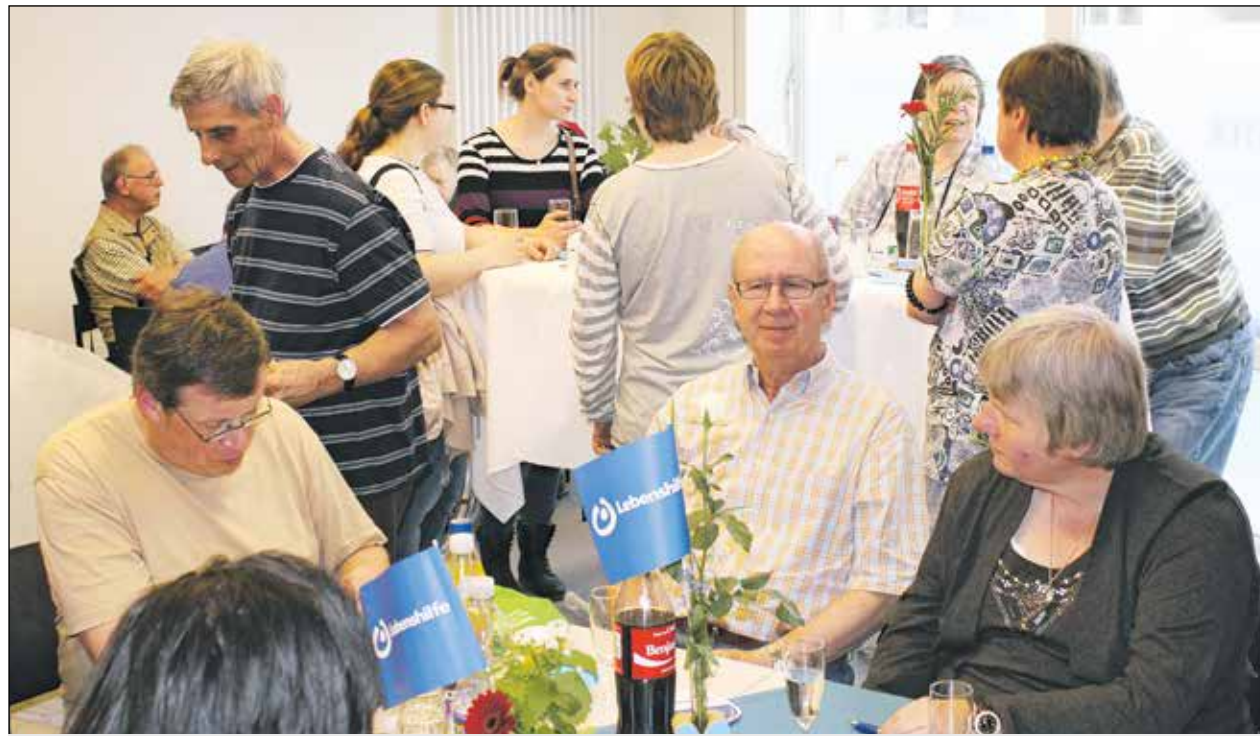
Im Lebenshilfe Center

Das Datum der Eröffnung zeigt auch den weiten Weg bis hierher. Denn am 8. Mai vor 70 Jahren endete mit der Kapitulation der Wehrmacht die Herrschaft der Nationalsozialisten. Es endete also eine Zeit, in der das Leben für Menschen mit geistiger Behinderung als nicht lebens-