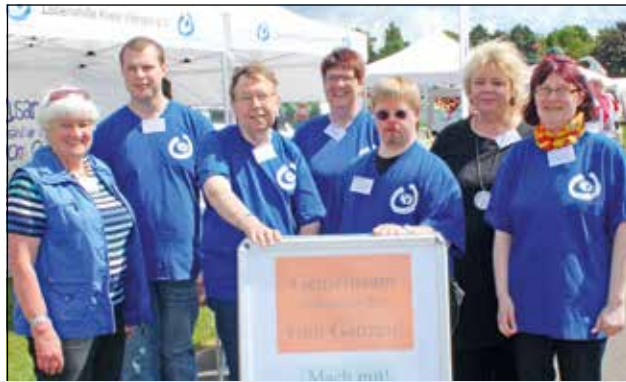
Zahlreiche Mitmach-Aktionen an den Ständen der Lebenshilfe Oberhausen (o. l./Karaoke), der Lebenshilfe Kreis Viersen (o. r./Malen) und der Lebenshilfe NRW (u. l./eine Form des Malens). Der Lebenshilfe Rat Kreis Viersen war auch dabei (u. r.).

Der „Tag der Begegnung“ des Landschaftsverbandes Rheinland (LVR) im Rheinpark und im Tanzbrunnen in Köln hat wieder zehntausende Menschen begeistert: In diesem Jahr fanden 35 000 Gäste ihren Weg zum europaweit größten inklusiven Familienfest für Menschen mit und ohne Behinderung. Auf der Bühne im Tanzbrunnen sorgten Querbeat, 2theuniverse, Björn Heuser und Brings für Stimmung – die kölsche Rockband war für Guildo Horn eingesprungen, der kurzfristig absagen musste. Auf kleineren Bühnen und Aktionsflächen gab es Zirkusakrobatik, Sportvorführungen, sportliche Aktionen, Musik und Theater zu sehen. Auch mehrere Orts- und Kreisvereinigungen der Lebenshilfe NRW wie die Lebenshilfen Rodenkirchen, Oberhausen, Mönchengladbach,