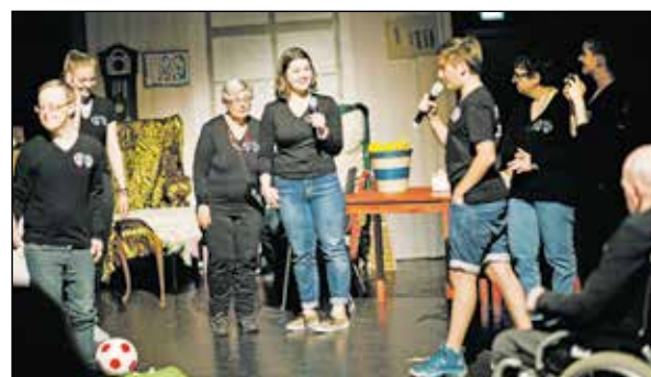
Der Besuch der Enkel startete bei Kaffee und Kuchen.

Ein Jahr hatte man jeden Mittwoch in den Räumen des Gymnasiums geprobt. Das Miteinander begann damit, dass die Schüler die Menschen mit Behinderung in der