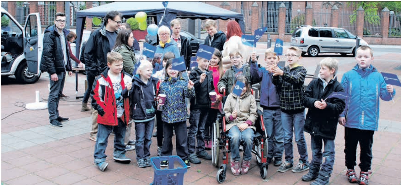
Gleich ganze Schulklassen besuchten das „Café Inklusion“ in der Fußgängerzone von Kevelaer.

Die „Freiwilligen Dienste“ der Lebenshilfe Gelderland luden zum „Café Inklusion“ ein