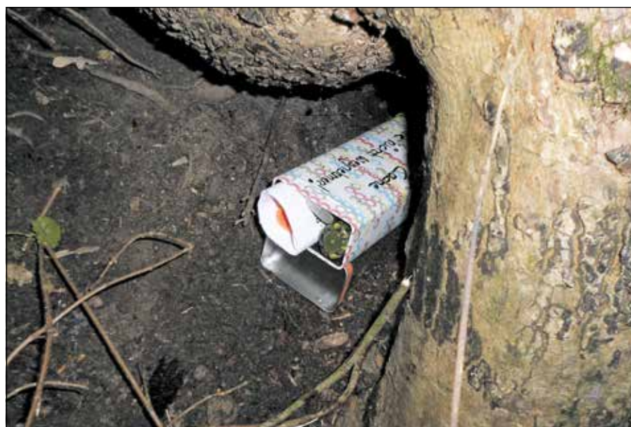
Versteck des Schatzes an ungewöhnlichem Ort

Zum Suchen nutzt man Mobiltelefone mit GPS. Ein GPS ist eine Art Navigationsgerät. In ein Navigationsgerät kann man eingeben, wohin man will und es zeigt einem, wie man dahin kommt. In den Caches ist ein kleines Heft (das Logbuch), in das man seinen Namen und das Datum der Suche schreibt. Oft sind auch kleine Gegenstände zum Tauschen in den Caches. Wenn man Gegenstände herausgenommen hat, muss