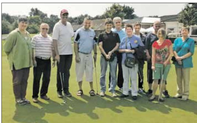
Benefiz-Golfturnier mit Spaßcharakter: Sportler mit Handicap übten Abschlagen auf der Anlage des Golfclubs Röttgersbach.

E in besonderer Tag war der 26. Juli in diesem Jahr für die sechs Sportler mit Behinderung, Mitglieder der Sportabteilung der Lebenshilfe Oberhausen. Sie nahmen zum ersten Mal am Benefiz-Golfturnier des Golfclubs Röttgersbach e. V., das seit vielen Jahren am „Zwei-Städte-Eck“ Duisburg und Oberhausen zugunsten der Lebenshilfe Oberhausen e. V. stattfindet.