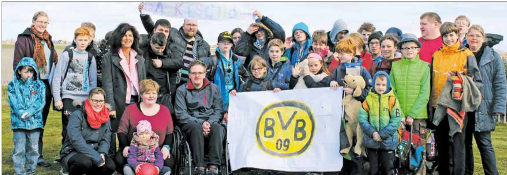
Dankeschön BVB: Kinder mit und ohne Behinderung hatten eine erlebnisreiche, gemeinsame Zeit auf Texel.

Kinder mit und ohne Behinderung begeistert / BVB-Stiftung fördert inklusives Ferien-Camp