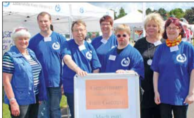
Zahlreiche Mitmach-Aktionen an den Ständen der Lebenshilfe Oberhausen (o. l./Karaoke), der Lebenshilfe Kreis Viersen (o. r./Malen) und der Lebenshilfe NRW (u. l./eine Form des Malens). Der Lebenshilfe Rat Kreis Viersen war auch dabei (u. r.).

Der „Tag der Begegnung“ des Landschaftsverbandes Rheinland (LVR) im Rheinpark und im Tanzbrunnen in Köln hat wieder zehntausende Menschen begeistert: In diesem Jahr fanden 35 000 Gäste ihren Weg zum europaweit größten inklusiven Familienfest für Menschen mit und ohne Behinderung. Auf der Bühne im Tanzbrunnen sorgten Querbeat, 2theuniverse, Björn Heuser und Brings für Stimmung – die kölsche Rockband war für Guido Horn eingesprungen, der kurzfristig absagen musste. Auf kleineren Bühnen und Aktionsflächen gab es Zirkusakrobatik, Sportvorführungen, sportliche Aktionen, Musik und Theater zu sehen.